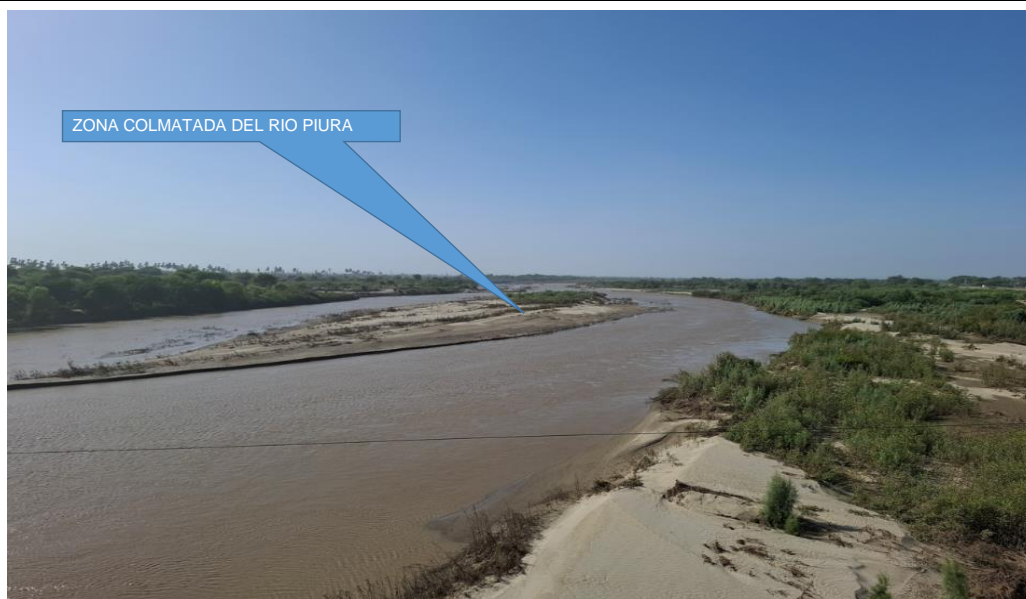
Figura N° 01: Se observa la colmatación del cauce del río Piura