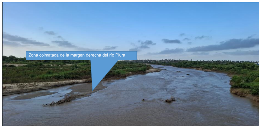
Figura N° 02: Se observa la colmatación en la margen derecha del cauce del río Piura